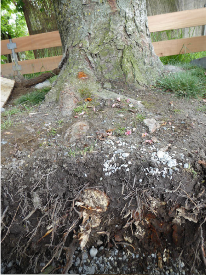
Teilweise Beschädigung des Wurzelstockes