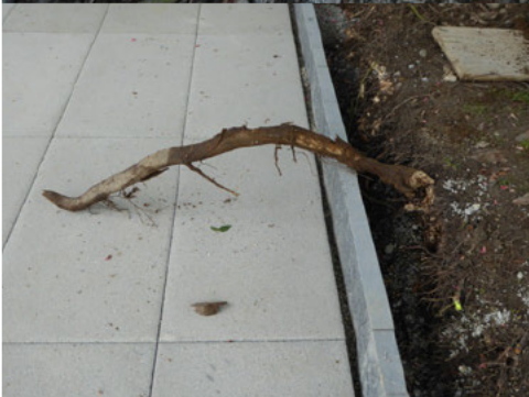
Teil einer abgerissenen Wurzel/ Länge 120cm