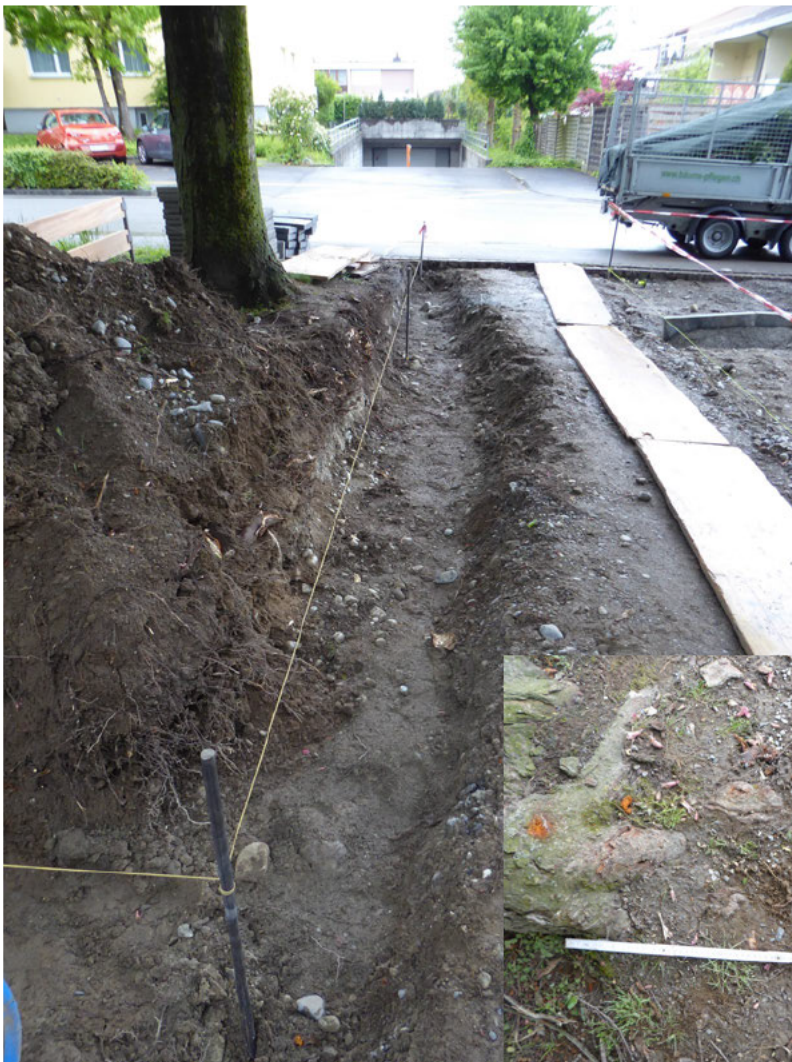
Grabung im Wurzelbereich der Scharlachkastanie