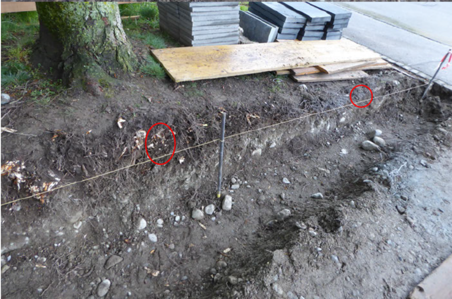
Lage Wurzelverletzungen Durchmesser: 1-15cm