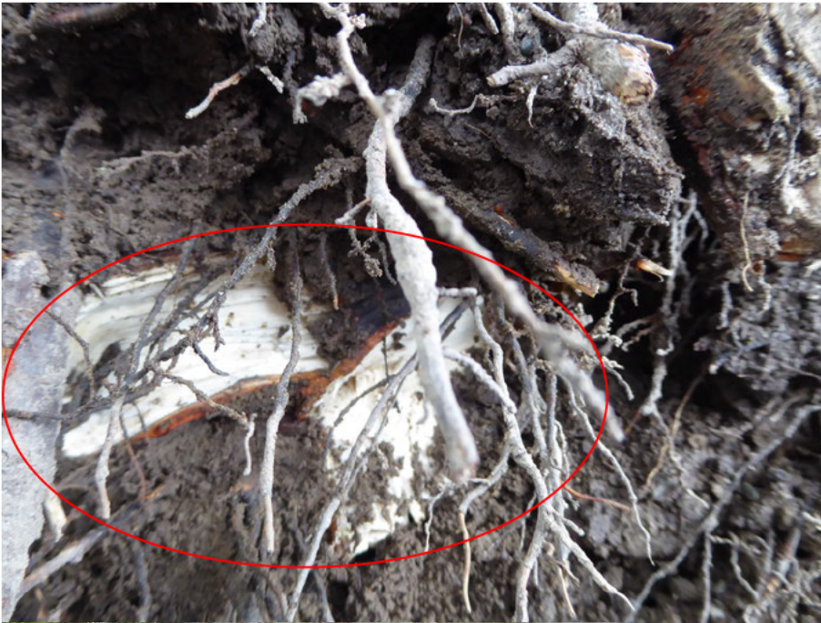
Nicht sofort sichtbare Wurzelverletzungen